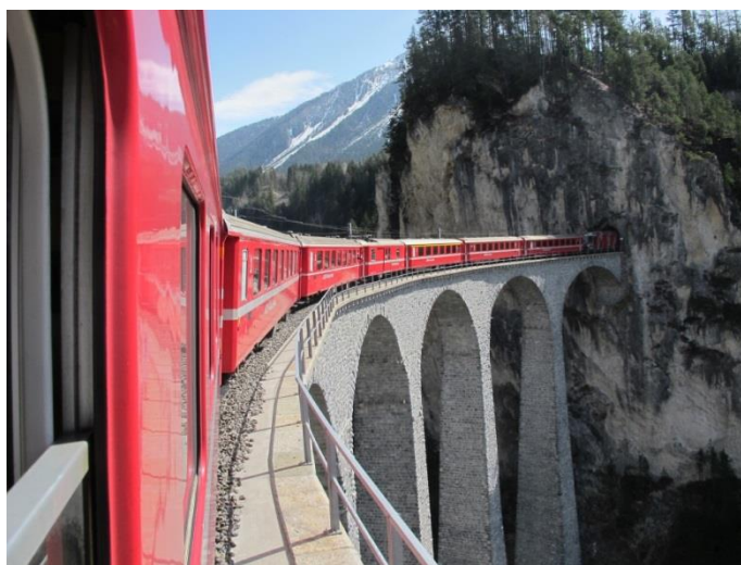
Landwasserviadukten på Rhätische Bahn. Loket försvinner just in i tunneln.

Kort efter viadukten kommer järnvägsknuten Filisur, där linjen mot Davos viker av. Varje hel timme kommer tågen in från Chur, från St. Moritz och från Davos och några minuter senare avgår tågen åt alla tre hållen. Med detta arrangemang erhålls mycket goda direkta anslutningar. Direkt vid stationen ligger Hotel Grischuna, rummen på ena sidan har utsikt ner mot dalen och på "baksidan" mot spåren. Gissa var banvänner helst vill övernatta!