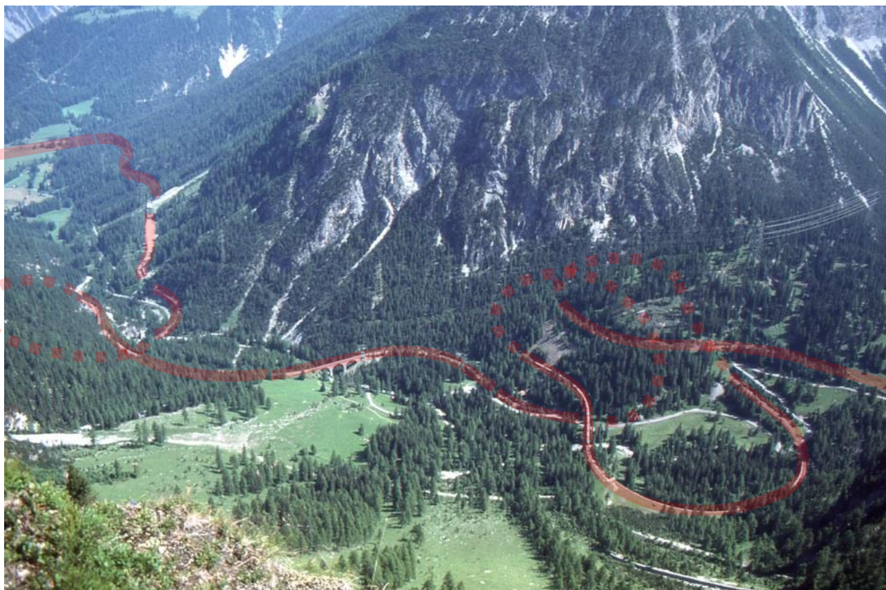
Övre delen av linjen mellan Bergün och Preda på Rhätische Bahn, bansträckningen markerad rött.

På övre änden av detta avsnitt ligger stationen Preda, där en mycket omtyckt vandringsled börjar, som leder ner längs banan mot Bergün. Tavlor är uppsatta med förklaringar längs leden. Från vandringsleden ser man ovanför och nedanför sig, hur järnvägen slingrar sig kors och tvärs genom dalen, se bilden nedan. Det känns som om man vandrar inne i en större modelljärnväg! Glöm inte kameran!