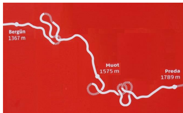
Linjen mellan Bergün och Preda på Rhätische Bahn

Från Bergün till Preda vid ingången till Albulatunneln är det fågelvägen 6 km och höjdskillnaden är 422 m. En direkt linje skulle därför få 70 % lutning och därmed bli för brant och ett hinder för långa tåg. För att få ner lutningen till den maximala 35 % som gäller för Albulabanan, valde man därför att förlänga linjen till 12 km genom att lägga den i slingor och i spiraltunnlar (Kehrtunnels), se skissen till höger. Dessutom måste man undvika ställen där laviner brukar gå ner. Hela avsnittet blev på detta sätt en enastående skapelse, där järnvägen på flera ställen leder över sig själv på 110 år gamla stenbroar. Det är förvillande att åka detta avsnitt, då det hela tiden växlar mellan vänster och höger sida av tåget vad som är upp och ner längs dalen.