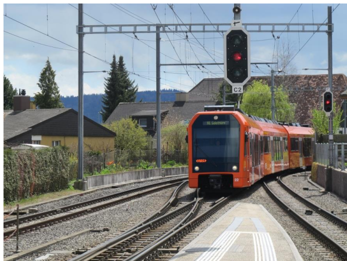
Det nya tåget på linjen Bern – Solothurn inkommer till Jegenstorf.

Om man vill köra med högre hastighet på Roslagsbanan bör det alltså redan finnas tåg som klarar detta. Det borde inte vara något större problem att göra tågen för 891 mm i stället för 1000 mm spårvidd.