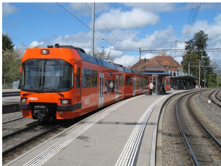
Jegenstorf på RBS-linjen Bern – Solothurn med lokaltåget till Bern.

För sträckan Bern – Solothurn, 33.6 km, behöver tåget 37 min, med 7 mellanstopp. Två av hållplatserna betjänas bara av vartannat tåg: vid den ena stannar bara tåget som avgår från Bern .05 och vid den andra bara tåget .35 från Bern.