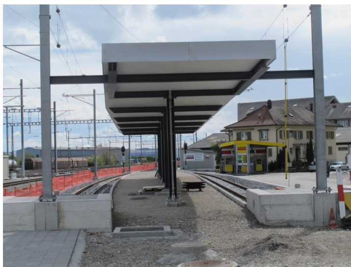
Den 2012 ännu inte färdiga slutstationen för banförlängningen Niederbipp-Oensingen. 22. april 2012

Ur svensk synvinkel är det kanske anmärkningsvärt att satsa på att förlänga en smalspårsbana. Vi får hoppas man man i Sverige ändå inte tvekar att också göra så. Jag tänker då på framtida projekt att förlänga den smalspåriga Roslagsbanan, bl.a. till Arlanda och till Norrtälje.